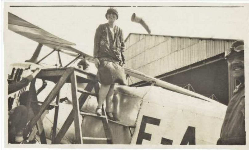
Bertha Lutz na cidade de Natal, em 1928

Não são todas as vezes que conseguimos ser ultores de nossos próprios atos. Todavia, a estatística e a pesquisa nos fazem estar sempre ponderando sobre o nosso futuro e o que poderá advir de nossos questionamentos. É notório o leque de diversificações que passou a família nos últimos dez anos e ousado dizer que é de extrema complexidade os processos que poderiam ser as molas motrizes destas mudanças. Mas tenho por certo que pelo menos os prognósticos de políticas sociais e econômicas; assim como as expectativas sobre casamento, filhos e relações de gênero foram as mais evidentes.