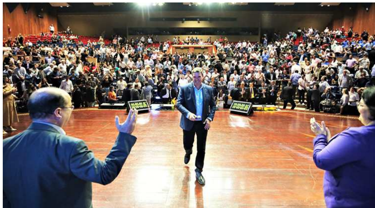
Governador no encerramento do evento