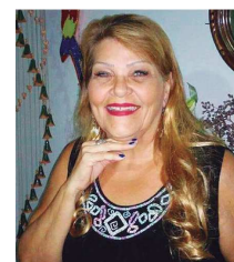
Por Mathilde Monaco*

Refloresce a natureza Umedeça o ar Traga o sorriso de volta Coloque mais vida na Terra.