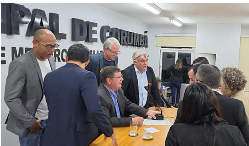
Aprovação do projeto pelos vereadores ocorreu durante sessão da Câmara

Fez parte da primeira turma de Letras do Instituto Superior de Pedagogia de Corumbá, hoje Universidade Federal de Mato Grosso do Sul – Campus Pantanal. Começou o curso em 1968, conciliando os