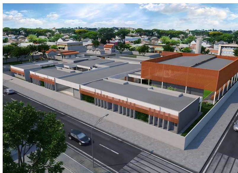
Projeto da escola de tempo integral que será construída no bairro Cristo Redentor.