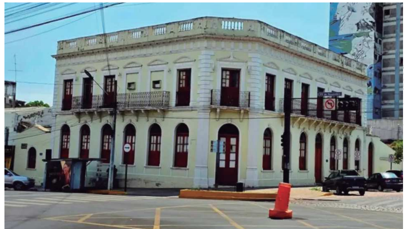
Execução das obras de restauração do prédio da antiga Prefeitura de Corumbá. O valor estimado para o investimento é de R$ 5.091.322,73.