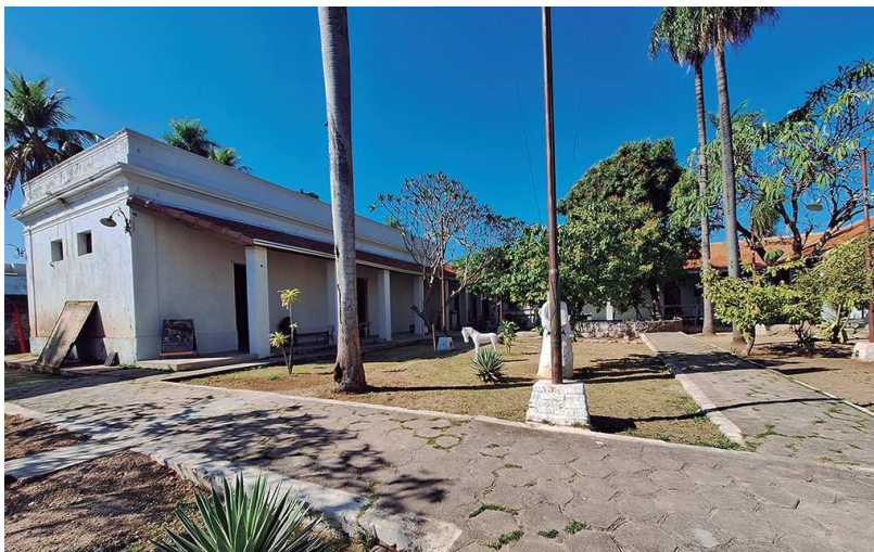
Execução das obras de restauração e ampliação da Casa do Artesão no valor total de R$ 4.326.000,00.