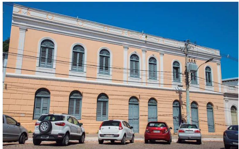
Execução das obras de restauração do antigo Hotel Internacional. O investimento estimado é de R$ 3.834.292,75.